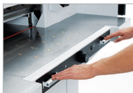
Commande bi-manuelle EASY-CUT