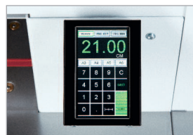
Commande électronique programmable avec écran tactile