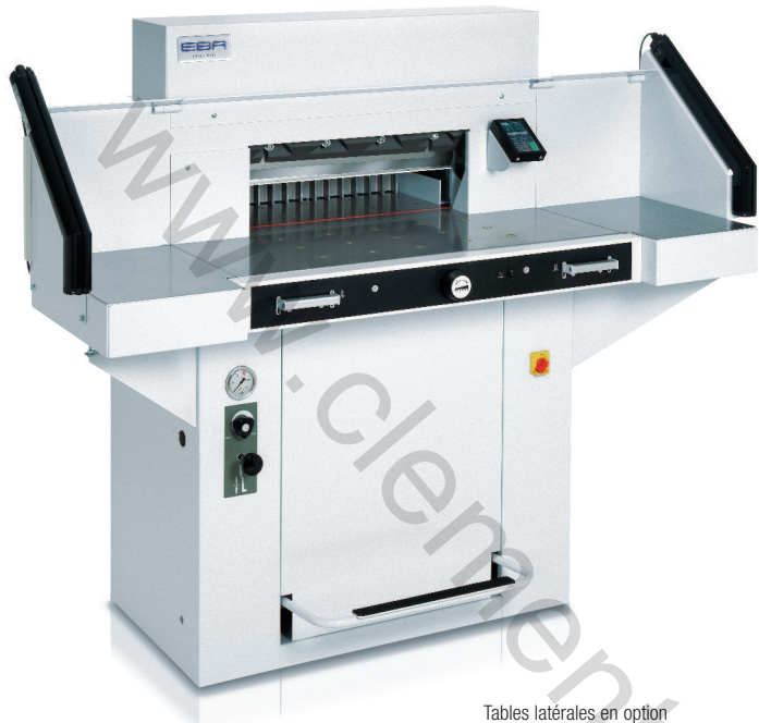
Tables latérales en option